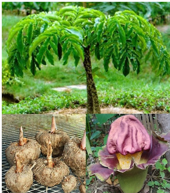
บุกคางคก