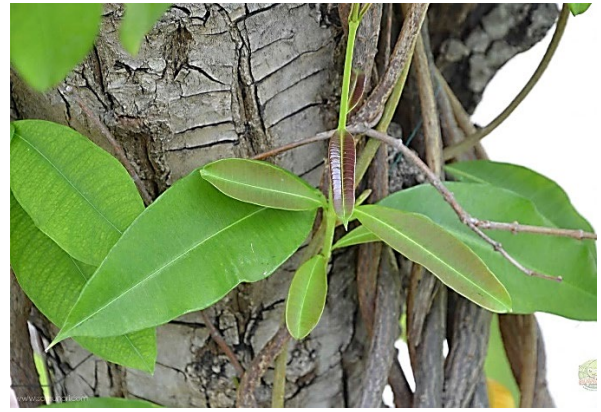
เถาเอ็นอ่อน