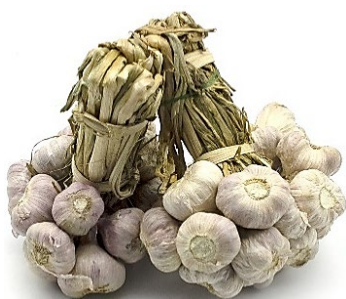
กระเทียม