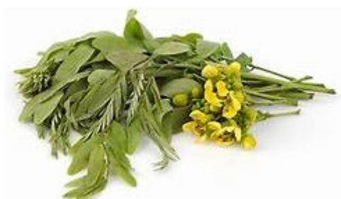
ขี้เหล็กบ้าน