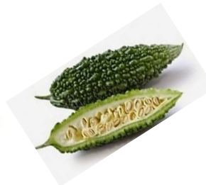
มะระขี้นก