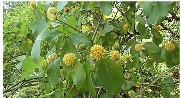
กระทุมนา