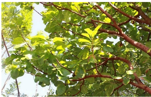
มะคังแดง