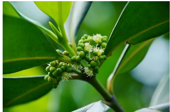
เจียงพ้านางแอ