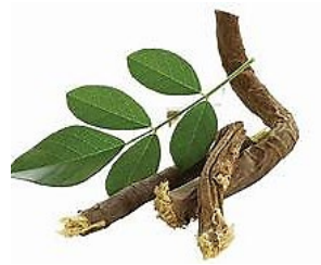
ชะเอมเทศ