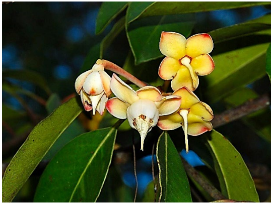
สารภีป่า