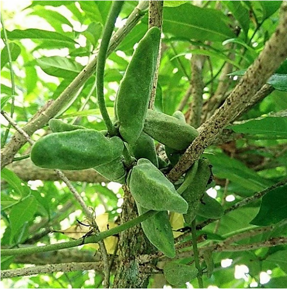
จุกโรหิณี