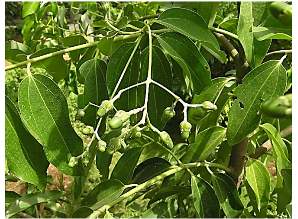
อบเชยไทย