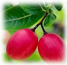
มะม่วงหาวมะนาวโห่