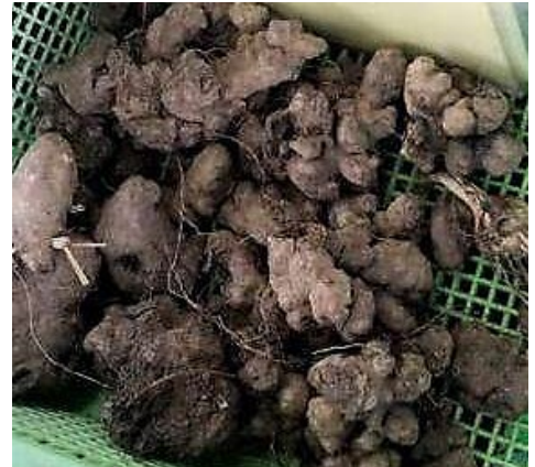
ว่านมหากาฬ