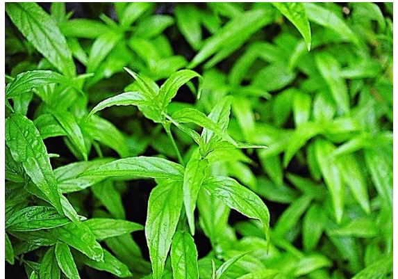
เสลดพังพอนตัวเมีย