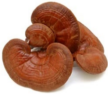
เห็ดหลินจือ

๑.๕ เครื่องสำอาง การนำพืชสมุนไพรมาใช้เป็นเครื่องสำอางมีมานานแล้ว และในปัจจุบันได้รับการยอมรับมากขึ้น เนื่องจากปลอดภัยกว่าการใช้สารสังเคราะห์ทางเคมี ทำให้มีผลิตภัณฑ์ที่ผลิตขึ้นโดยมีส่วนผสมของพืชสมุนไพรเกิดขึ้นมากมาย เช่น แชมพู ครีมนวดผม สบู่ โลชั่น ฯลฯ ตัวอย่างพืชสมุนไพรที่นำมาใช้เป็นเครื่องสำอางเช่น อัญชัน ว่านหางจระเข้ มะค้ำดีควาย เห็ดหลินจือ, มะกรูด เป็นต้น