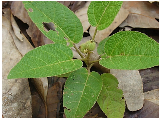
เจตพังคี