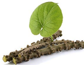
บอระเพ็ด