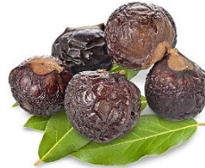
มะค้ำดีควาย