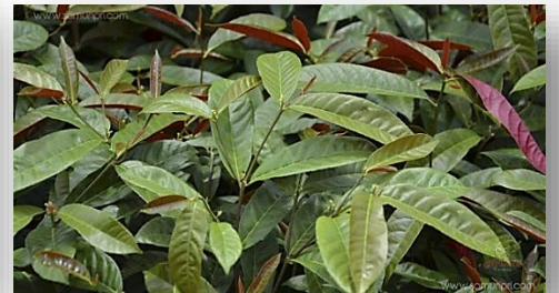
กระป๋อเจ็ดตัว