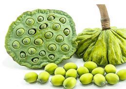
เมล็ดบัว