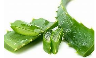
ว่านหางจระเข้

๑.๖ ผลิตภัณฑ์ป้องกันกำจัดศัตรูพืช เป็นสมุนไพรที่มีฤทธิ์เบื่อเมาหรือมีรสขม ซึ่งมีคุณสมบัติในการปราบหรือควบคุมปริมาณการระบาดของแมลงศัตรูพืช โดยไม่มีพิษตกค้างในผลผลิต ไม่มีพิษต่อผู้ใช้และสภาพแวดล้อม ตัวอย่างพืชสมุนไพรที่ใช้ป้องกันกำจัดศัตรูพืช เช่น รากหนอนตายหยาก สะเดา ยาสูบ ตะไคร้หอม ฟ้ายะลวยโจร ไพล ทางไหล (โล่ตีน) เป็นต้น