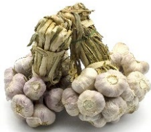
กระเทียม