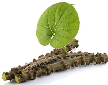
บอระเพ็ด