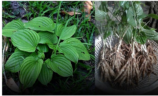
หนอนตายหยาก