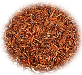
ดอกคำฝอย