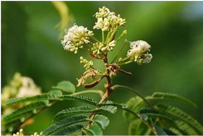
ชะเอมไทย