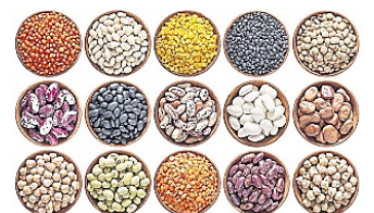
เมล็ดถั่วต่างๆ