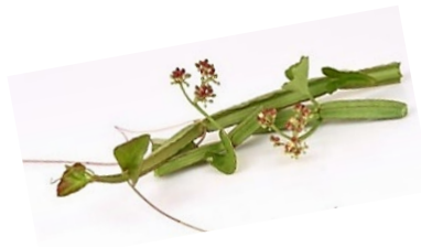
เพชรสังฆาต