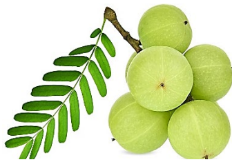
มะขามป้อม