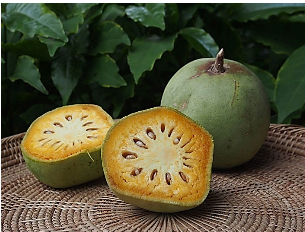
มะตูมน้ำ