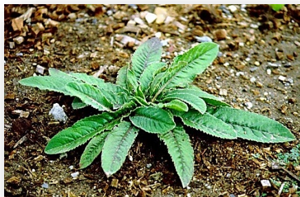
โดไม่รู้ล้ม