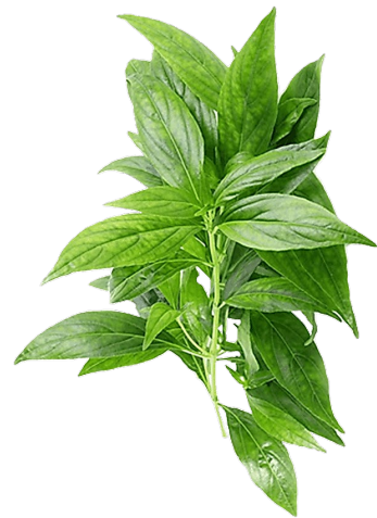
ฟ้าทะลายโจร