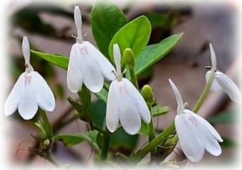
ทองพันชั่ง