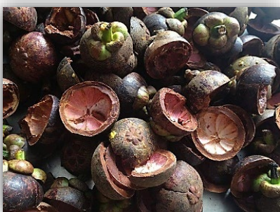
เปลือกมังคุด