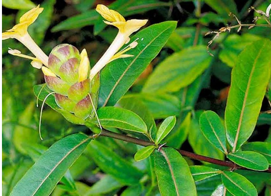
เสลดพังพอนตัวผู้