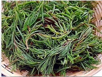
ผักชะคราม