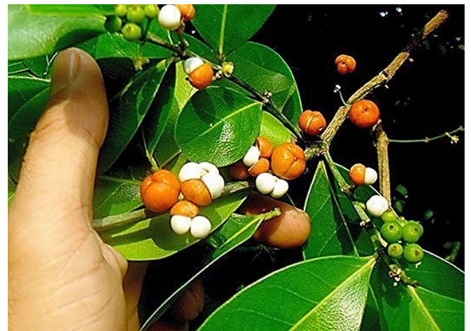
ชันทองพญาบาท