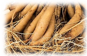
รากสามสิบ