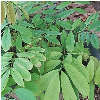
ทางไหล (โล่ตีน)

๑.๖ ผลิตภัณฑ์ป้องกันกำจัดศัตรูพืช เป็นสมุนไพรที่มีฤทธิ์เบื่อเมาหรือมีรสขม ซึ่งมีคุณสมบัติในการปราบหรือควบคุมปริมาณการระบาดของแมลงศัตรูพืช โดยไม่มีพิษตกค้างในผลผลิต ไม่มีพิษต่อผู้ใช้และสภาพแวดล้อม ตัวอย่างพืชสมุนไพรที่ใช้ป้องกันกำจัดศัตรูพืช เช่น รากหนอนตายหยาก สะเดา ยาสูบ ตะไคร้หอม ฟ้ายะลวยโจร ไพล ทางไหล (โล่ตีน) เป็นต้น