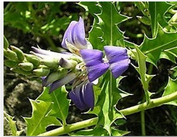
เหงือกปลาหมอ