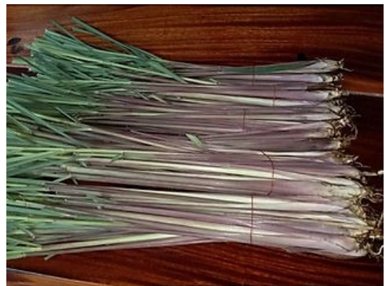
ตะไคร้หอม