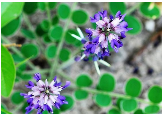
ถั่วดินโคก