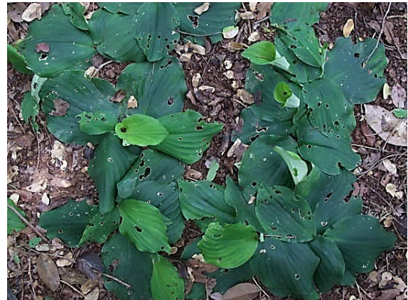
เปราะหอม