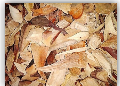
เปลือกคูน