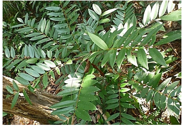
ปลาไหลเผือก