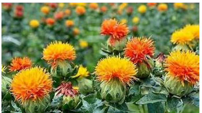
ดอกคำฝอย