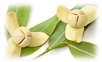
ดอกลำดวน