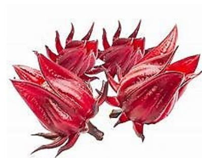
กระเจี๊ยบแดง