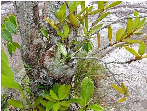
หัวร้อยรู