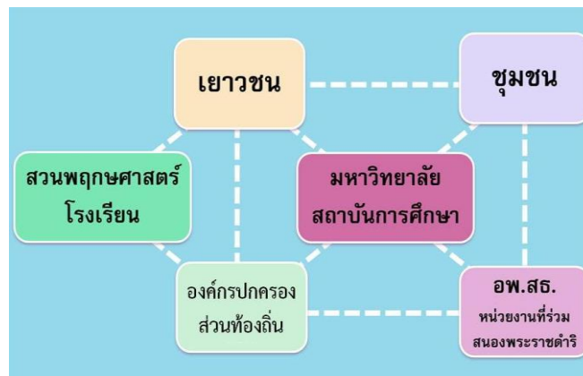
แผนภาพแสดงความสัมพันธ์การดำเนินงาน โครงการอนุรักษ์พันธุกรรมพืชอันเนื่องมาจากพระราชดำริฯ และหน่วยงานที่ร่วมสนองพระราชดำริในการดำเนินงานฐานทรัพยากรท้องถิ่น

โครงการอนุรักษ์พันธุกรรมพืชฯ (อพ.สธ.) ได้ดำเนินการสนับสนุนให้องค์กรปกครองส่วนท้องถิ่น (อปท.) เข้าร่วมสนองพระราชดำริ ในการดูแลรักษาทรัพยากรธรรมชาติและสิ่งแวดล้อมในท้องถิ่น และริเริ่มการทำฐานทรัพยากรท้องถิ่นที่เป็นทรัพยากรกายภาพ ชีวภาพ วัฒนธรรมและภูมิปัญญา โดยเริ่มจากระดับขององค์การบริหารส่วนตำบล (อบต.) ซึ่งเป็นผู้ดูแลทรัพยากรธรรมชาติท้องถิ่นตามรัฐธรรมนูญ และดำเนินการร่วมกันระหว่างชุมชน เยาวชน โรงเรียน หน่วยงาน สถานศึกษาในท้องถิ่น และสถาบันการศึกษาระดับอื่น ๆ ดังแสดงในแผนภาพ